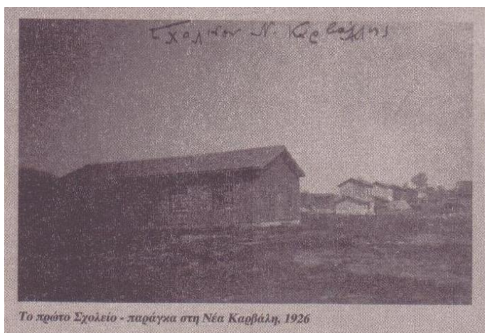
Το πρώτο Σχολείο - παράγκα στη Νέα Καρβάλη, 1926

Το σχολείο αρχικά στεγαζόταν σε ένα ξύλινο παράπηγμα. Είχε 377 μαθητές η κοινότητα από 6 - 15 ετών (197 αγόρια και 180 κορίτσια), που έμεναν για την ώρα αγράμματοι. Το χειμώνα του 1925 το σχολείο χρησιμοποιήθηκε ως νοσοκομείο. Το Ιανουάριο του 1926 με πολλές δυσκολίες αρχίζει να λειτουργεί το σχολείο με προσωπικό που πληρώνει η κοινότητα. Η έγκριση για τη σύσταση τριτάξιου δημοτικού