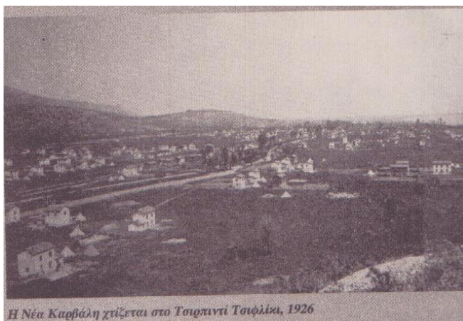
Η Νέα Καρβάλη χτίζεται στο Τσιφιντί Τσιφλίκι, 1926

Το χτίσιμο των σπιτιών της νέας κοινότητας αρχίζει το καλοκαίρι του 1925, γίνεται όμως τόσο αργά που η αρχική αισιοδοξία των κατοίκων εξανεμίζεται. Από τα 500 σπίτια που θα χτίζονταν ως τις αρχές του Αυγούστου χτίστηκαν μόνο είκοσι πέντε. Ο χειμώνας του 1925-1926 στάθηκε επίσης αρκετά σκληρός. Μόνο 143 σπίτια ήταν έτοιμα, αλλά οι εργασίες σταμάτησαν από έλλειψη πιστώσεων. Τότε 71 οικογένειες εγκατέλειψαν τη Νέα Καρβάλη.